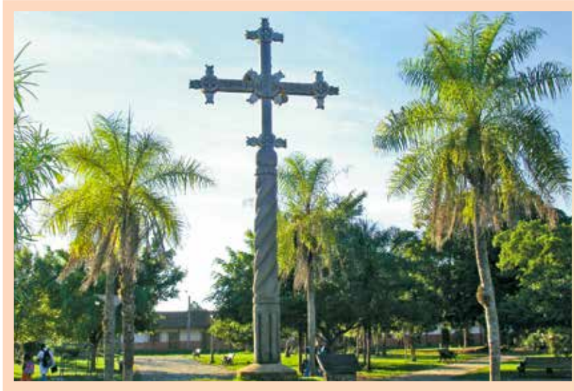
(Plaza principal de san Javier-Santa Cruz de la Sierra, Bolivia)

La Cruz de la Evangelización , que acompaña nuestro itinerario de preparación al “Vº Congreso Americano Misionero,” tiene historia, tiene identidad que hemos de conocerla, de sentirla, de experimentarla. Esta atracción, que le viene por su referencia a Cristo, aumenta de dosis con la bendición de las réplicas por el Papa Francisco, durante su reciente Visita Apostólica a Bolivia y la entrega de las mismas a los representantes de cada Iglesia local del Continente con el fin de fortalecer la animación misionera en nuestros países y más allá de nuestras fronteras.